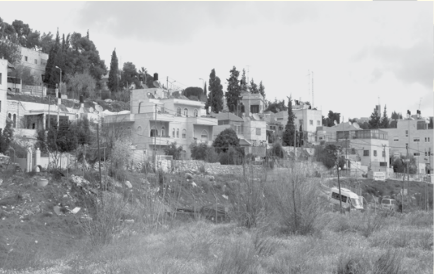
مساحة شاغرة في وسط كرم الجاعوني

طوّل المبادرين إلى المخطط القيام بإدخال تغييرات جوهرية في المخطط، من أجل الموازنة بين الاحتياجات المحلية للسكان وبين الحاجة إلى الاستمرار في حفظ واجهة حوض البلدة القديمة وتقويتها كمركز سياحي، مورست عليهم ضغوطات من قبل جمعيات استيطانية مختلفة تعمل في المنطقة نتيجة لذلك، طلبت البلدية عدم شمل منطقة "مغارة الرميان" في المخطط والتي تقع على ما يبدو قرب قبر شمعون الصديق. ورغم اختلاف في الرأي حول الأهمية الدينية للموقع، أعلن عن المنطقة على أنها منطقة مقدسة، واستخرج من المخطط الذي تقدم به السكان، وخصص كبناء عام. يبدو واضحا أن مجموع الاعتبارات لدي صنّاع القرار بهذا الشأن لم تنطرق أساسا إلى مصلحة سكان الشيخ جراح والأحياء المحيطة به.