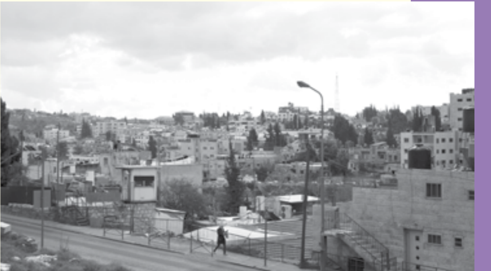
حي اللاجئين في حي الجاعوني

المخطط الهيكلي الجديد القدس 2000، الذي ينتظر الإيداع، يؤشر على حي الشيخ جراح كمناطق بلدية قائمة. شريط الأرض القائمة بين طريق نابلس وشارع رقم 1 البلدي مخصص وفقا للمخطط للسكن لغاية ستة طوابق. من الناحية