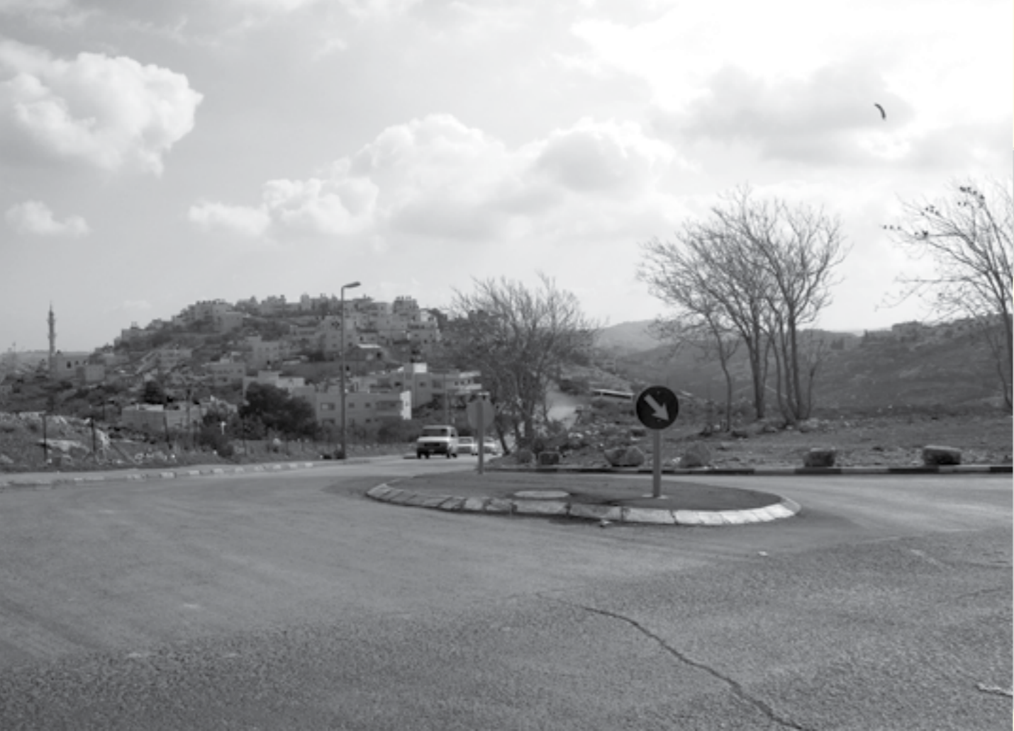
المدخل المحسن إلى الحي

وقد قدم السكان اعتراضا على تعديل مخطط التوسيع وتم قبول إعتراضهم. في تموز 2012 سرى مفعول مخطط معدل يعيد مفعول مسار الدخول الذي تم الغاؤه في العام 2005، وإلى حين تنفيذ المدخل القديم الجديد، فقد أحدثت بلدية القدس تحسينات ملحوظة في مفترق الدخول القائم، بما في ذلك إقامة جزيرة، مما أوجد حولا لمعظم مشاكل الأمان.