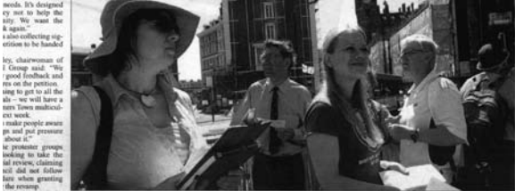
King's Cross campaigners look for support to force Camden Council into a complete rethink for the area.

Groups collect signatures for petition demanding a total U-turn