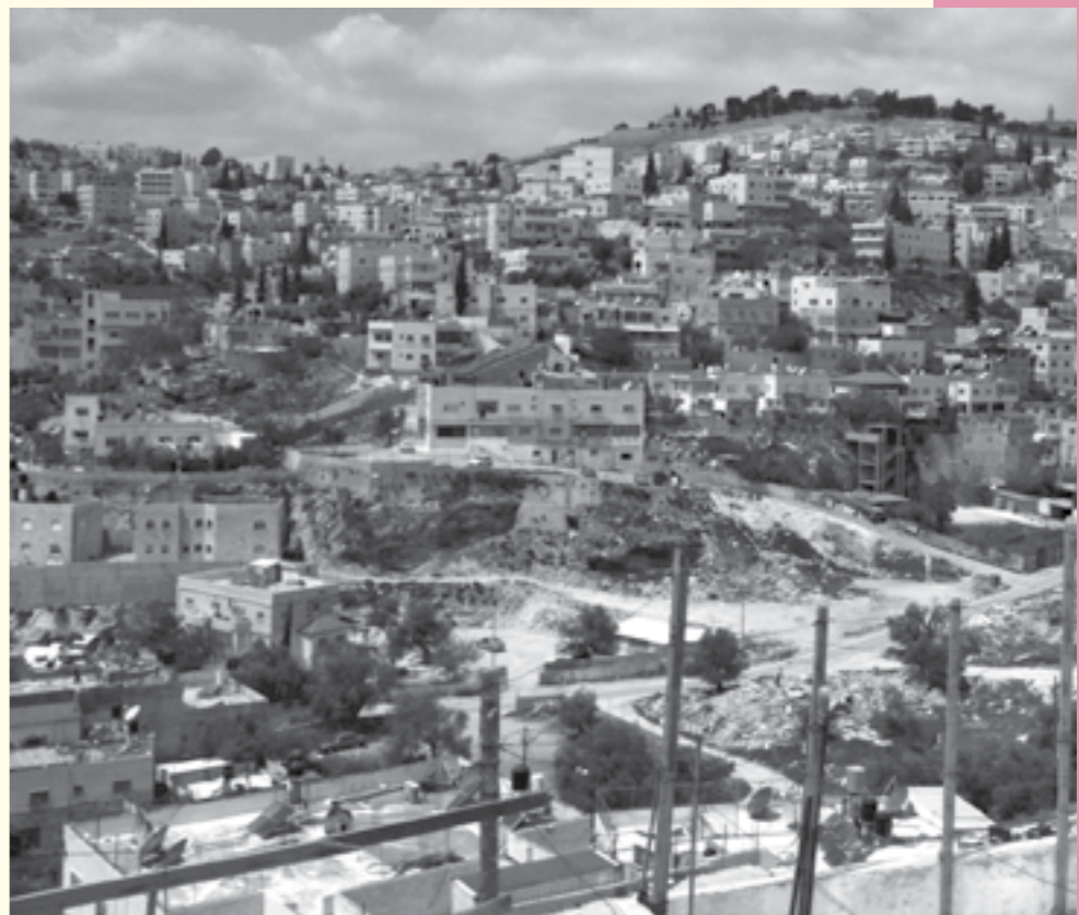
התוואי העתידי של כביש הטבעת המזרחי

כביש הטבעת המזרחי מתוכנן לעבור מצפון לדרום במזרחה של ירושלים. חלק מהמקטע המרכזי שלו, שאושר במסגרת תוכנית 4585'ב, מתוכנן לעבור בעומק שכונת ואדי קדום, בוואדי המרכזי ובגדה המזרחית שלו. למעבר הכביש בשכונה השלכות מרחיקות לכת עבורה – ביטול כעשרים