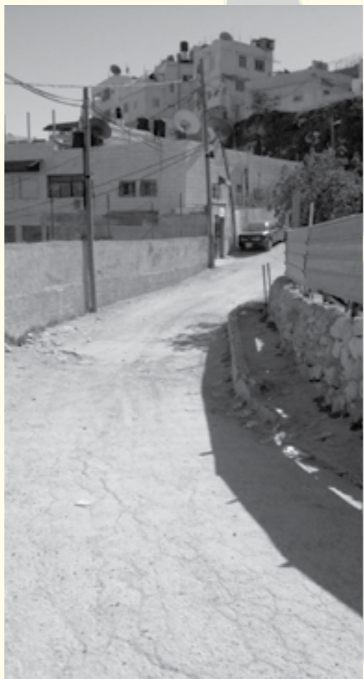
פיסת מדרכה כגשר מעל השלולית העונתית

בלב השכונה עוברים קו ביוב ראשי אחד וקו ניקוז. מדובר במערכות ישנות, לא תקינות ולא מתוחזקות. פתחי הניקוז סתומים לחלוטין ואילו פתחי הביוב בולטים על פני השטח באופן הגורם, לא אחת, לתאונות דרכים. מערכת הניקוז אינה עומדת בעומס. מי הגשמים שמתנקזים אל הוואדי מהר הזיתים, אש-שיח וראס אל-עאמוד גורמים במקרים של גשמים חזקים לכך שמפלי מים נשפכים מכיוון דרך יריחו אל השכונה. מכיוון ראס אל-עאמוד מתנקזים מי הגשם באופן קבוע אל השכונה וזורמים בחצרות הבתים ובדרכים. חלק ממי הגשמים חודר למערכת הביוב הרעועה אשר עולה על גדותיה, מציפה את הוואדי וגורמת למפגעי ריח קשים. בשל בעיות הניקוז, בתחתית הוואדי נוצרת שלולית עונתית החוסמת את הגישה אל הבתים הסמוכים אליה. התושבים בנו קטע מדרכה קצר כגשר מעל לאזור המועד (ראו תמונה).