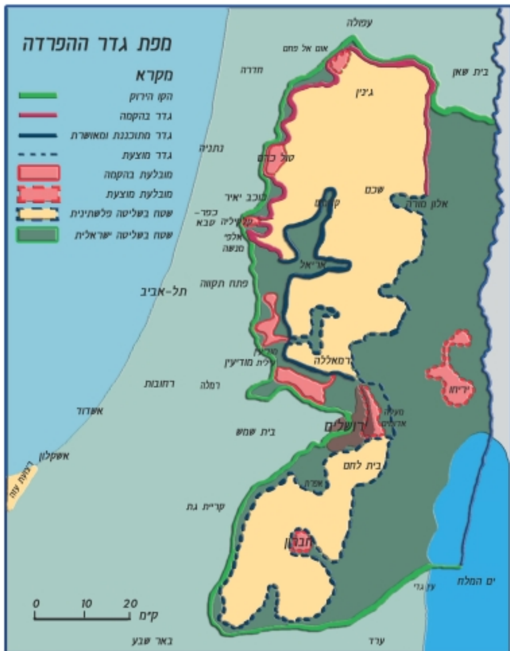
מיפוי- נעמה שחר. המפה האכנה על-פי מפה שפרסמה ב"דיעות אחרונות", 23.5.03