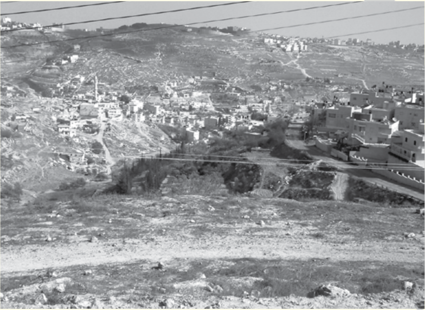
השטח ה"רוק" הגדול

נבחר מתכנן והתקציב שהוקצה למיזם היה מצומצם ובלתי מספיק. למרות שתכולת השטח מגיעה לכ- 5,000 יח"ד (לפי הערכה מקצועית שנעשתה ביחזמת תושבים), נדרש המתכנן לאפשר בנייה של 2,500 יח"ד בלבד, מספר שירד מאוחר יותר ל-1,500. עובדות אלו לא מנעו מהעירייה לסמן את הפרויקט כפרויקט דגל, ולהזכיר אותו כשביקשה להוכיח כי היא עושה די לפיתוח השכונות הפלסטיניות של ירושלים המזרחית.