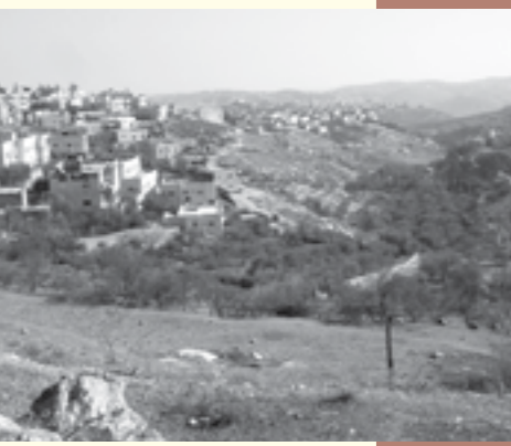
מגרשים פנויים בשכונה