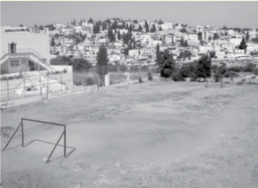
מגרש הכדורגל ובתי שכונת ואדי אג'ג'וז ברקע