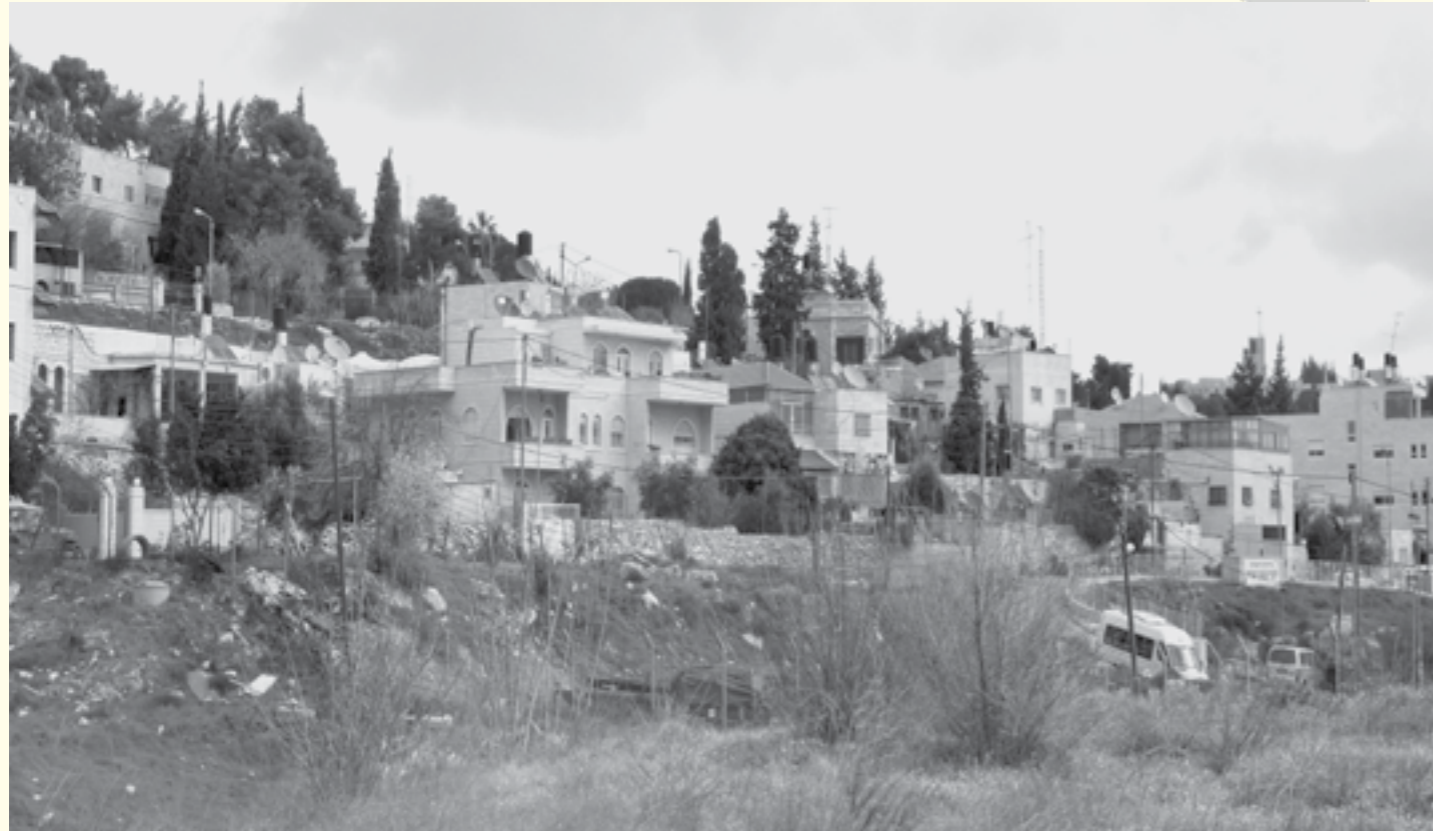
שטח פנוי במרכז כרם אג'–ג'אעוני