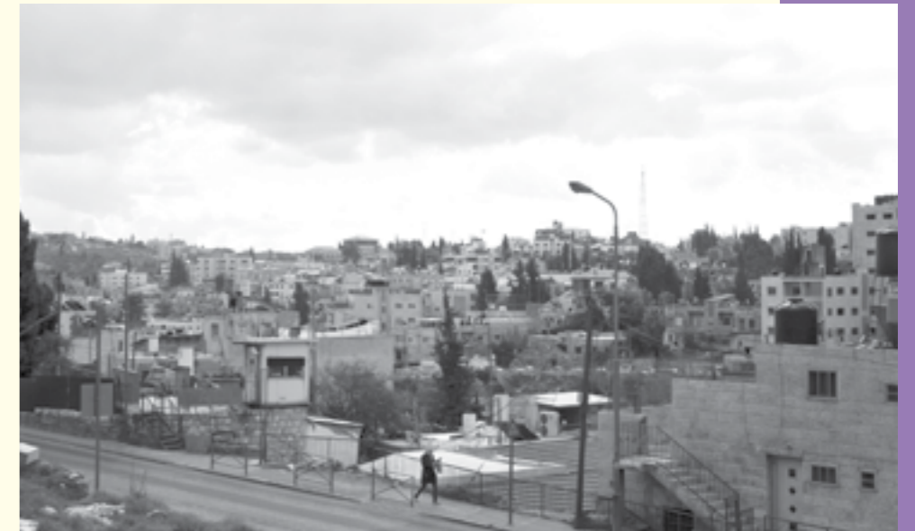
שכונת הפליטים בכרם אג'–ג'אעוני