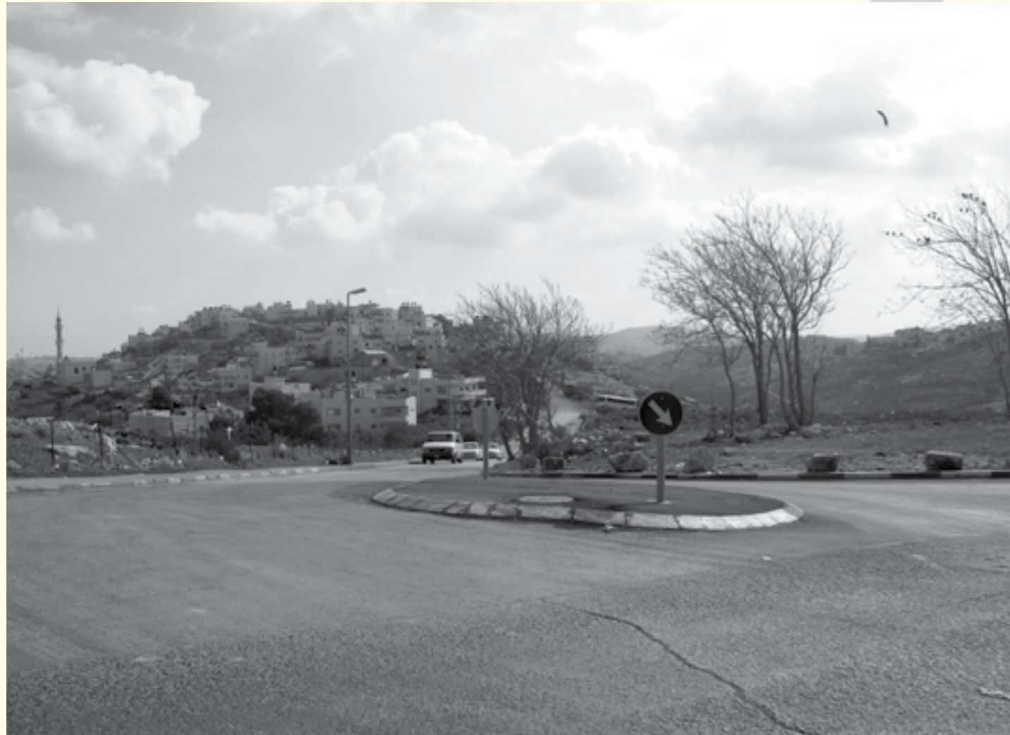
הכניסה המשופרת לשכונה

בעוד התושבים מתכוננים לפנות לעירייה בדרישה לסדר את צומת הכניסה לשכונה, ראו שלט פרסום של רשויות התכנון